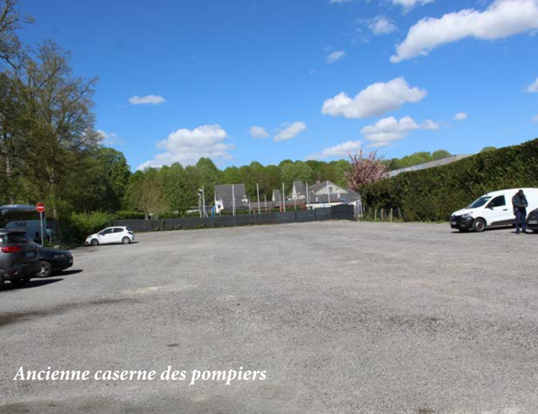
Ancienne caserne des pompiers