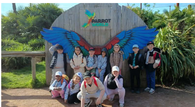
Accueil de loisirs vacances de printemps