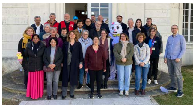
Animation « Chasse aux oeufs »