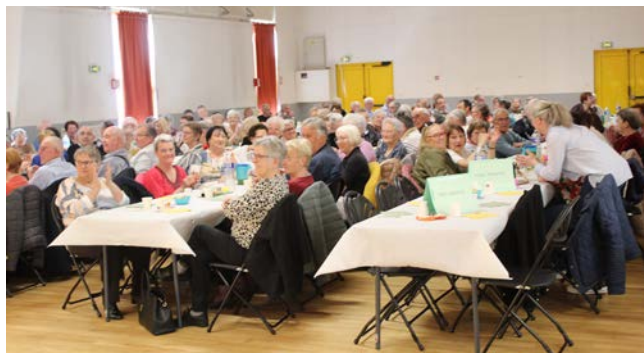
Gôûter de printemps du CCAS