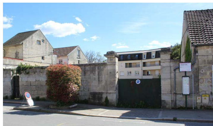
Ancien local des Scouts rue du 18 juillet