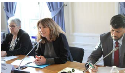
Premier Conseil Municipal

Enfin, je tiens à saluer l'engagement constant des services municipaux. Leur mobilisation quotidienne est essentielle à la mise en œuvre de ces actions et à la qualité du service rendu aux habitants.