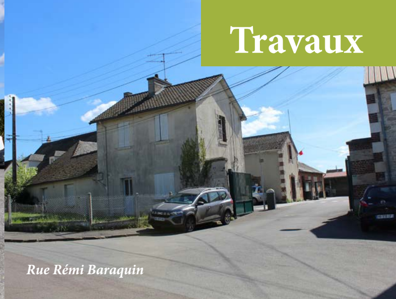
Rue Rémi Baraquin