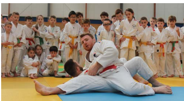
Interclubs de Judo et venue du champion olympique Axel Clerget