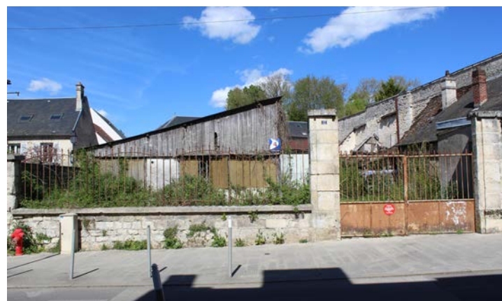
Angle rue de la faisanderie et rue du Général Leclerc

facilitée, avec une entrée rue du Général Leclerc et une sortie rue de la Faisanderie. Cet aménagement contribuera à renforcer l'offre de stationnement en centre-ville, améliorer le confort des usagers et faciliter l'accès aux commerces.