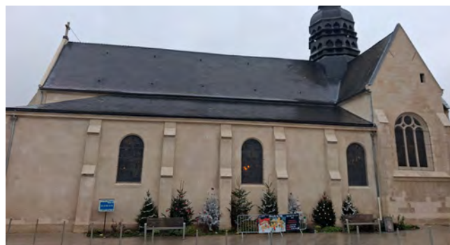
Inauguration de l'église