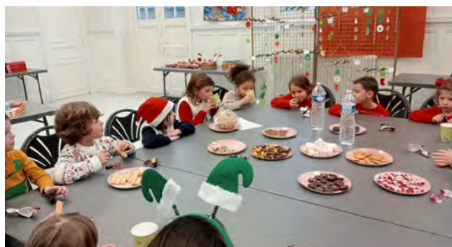
CMJ et la lettre au Père Noël