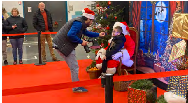
Marché de Noël 2025