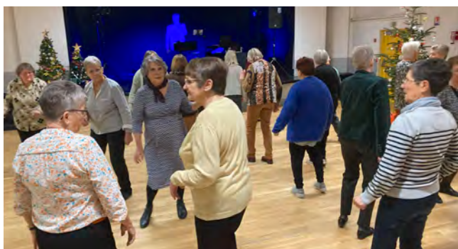
CCAS : Goûter de Noël