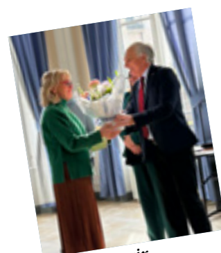
Remise des prix des maisons et balcons fleuris

Nous sommes parfaitement conscients de la gêne occasionnée par ces travaux, mais nous ne pouvons plus attendre sachant que d'autres opérations vont devoir être programmées telles que les rues Hauterive, Aristide Briand et Demoustier.