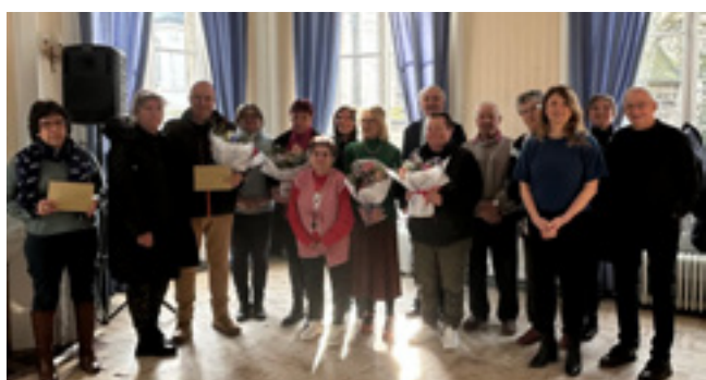
Remise des prix du concours des balcons et maisons fleuris