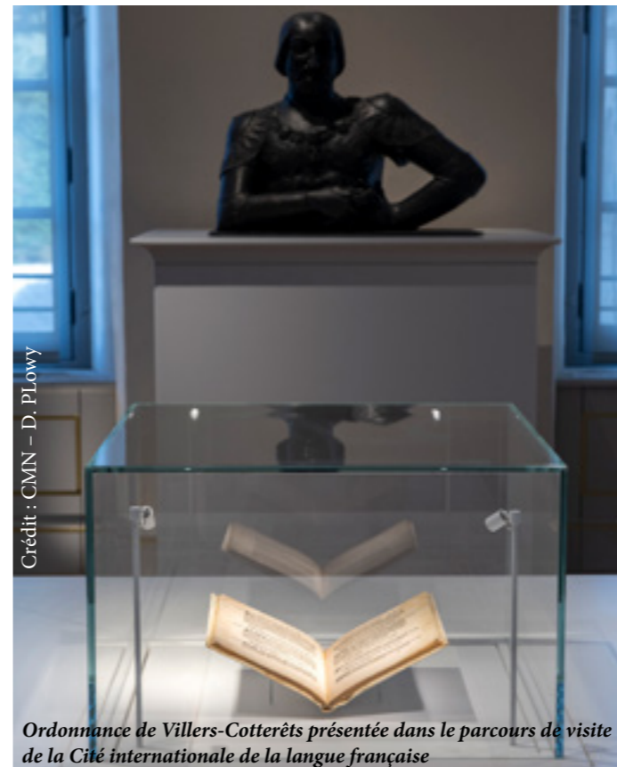
Ordonnance de Villers-Cotterêts présentée dans le parcours de visite de la Cité internationale de la langue française