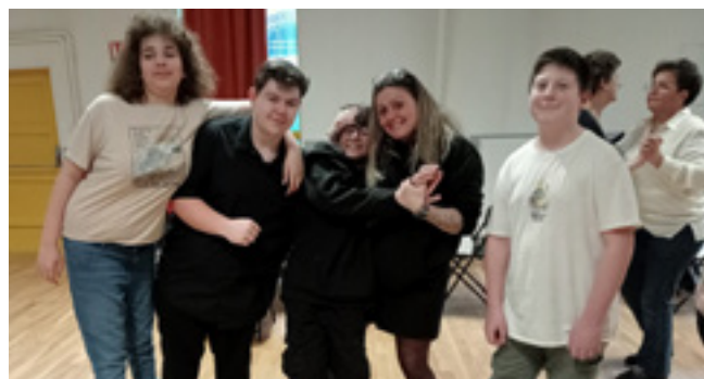
Teender séniors 2025 organisé par le CMJ