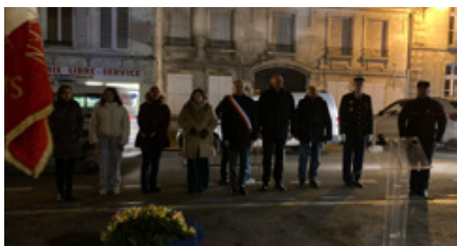
Hommage au Général Dumas