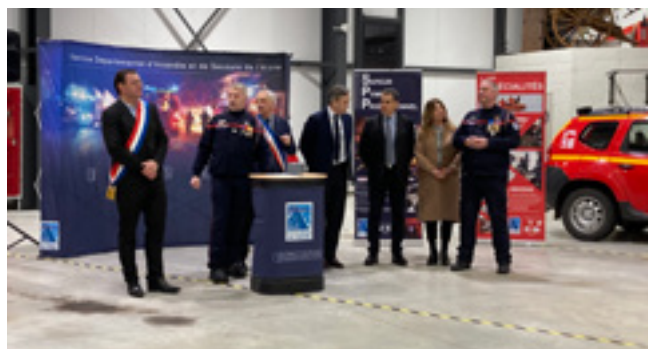
Sainte Barbe 2025